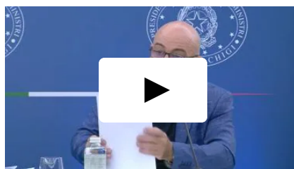
Economia Gas, Cingolani: "Stoccaggi al 70%, c'e' forte accelerazione"