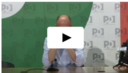
Italia Concentrato e pensieroso, ecco l'espressione di Letta durante la conferenza con Di Maio e Tabacchi