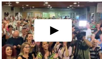
Italia Pubblico acclama Salvini e grida "Matteo". Il leader della Lega: Renzi potrebbe pensare che per lui