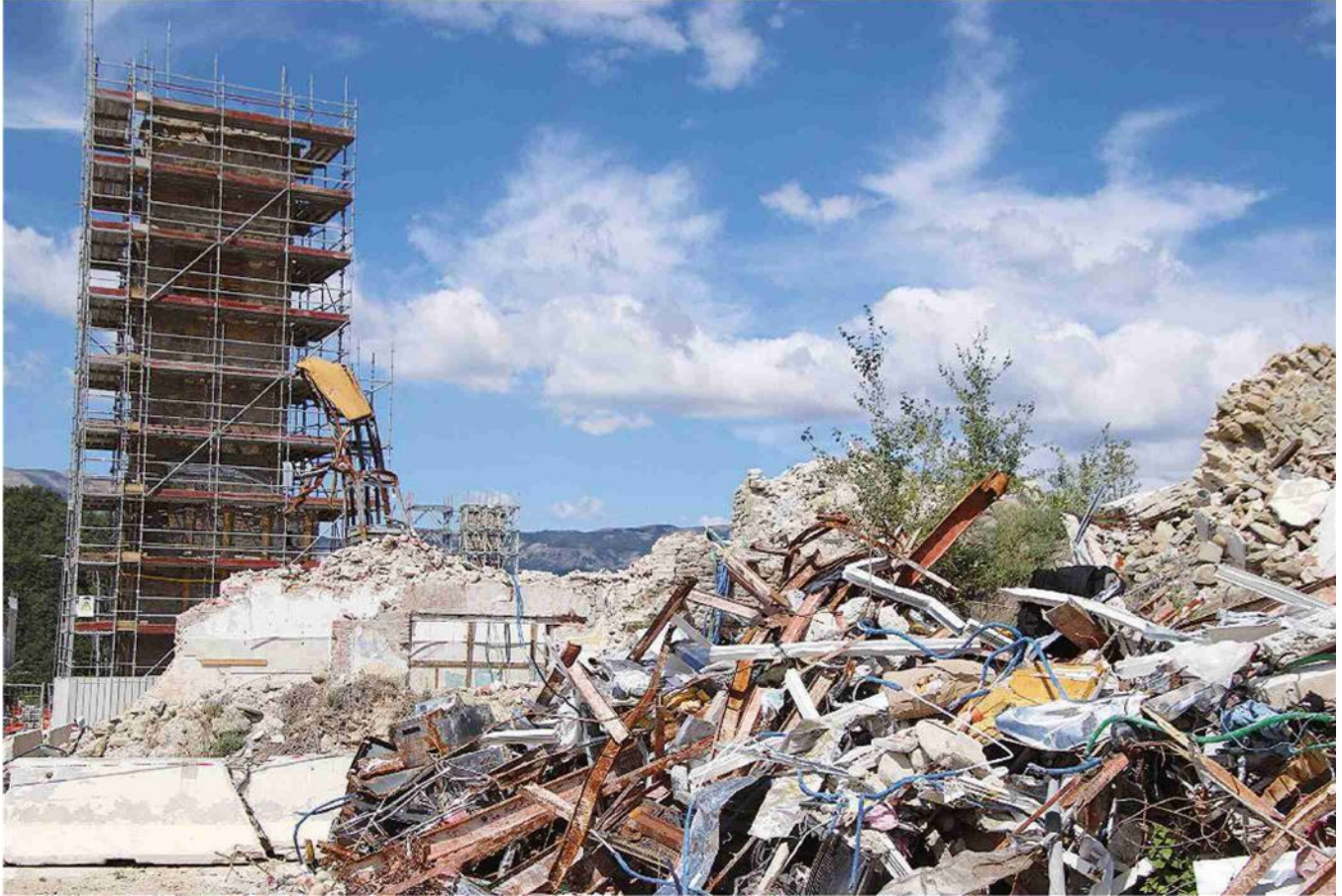
I cantieri nella cittadina di Amatrice, distrutta dal terremoto del 24 agosto 2016. La torre civica in ristrutturazione e le ultime macerie