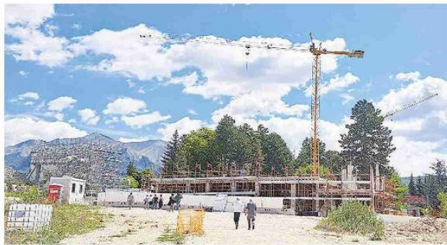
Il cantiere del primo comprensorio sorto in zona rossa