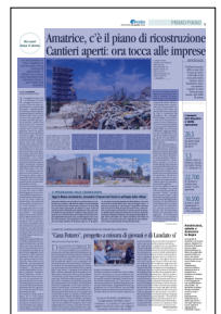
Peso: 1-11%, 9-60%