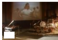
Morto Vangelis, sue le colonne sonore di "Blade Runner" e "Momenti di gloria"