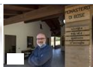
Dalla Parola di Dio all'ecumenismo: la profezia continua, la comunità di Bose, oggi