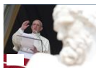
L'Angelus con papa Francesco: la diretta