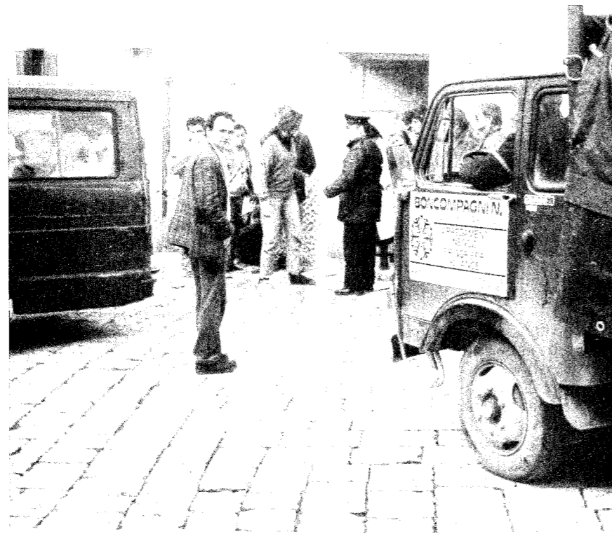
Il pulmino della Caritas attira la curiosità degli Albanesi.

Ci portiamo quindi nella Parrocchia più vicina: quella della Cattedrale. Con il camion ed il pulmino Caritas ci permettono i sensi vietati ed arriviamo subito davanti alla Cattedrale. Penso di non aver visto la Cattedrale. Subito la piazza si popola di gente che viene ad aiutare a scaricare: alcuni volontari e molti