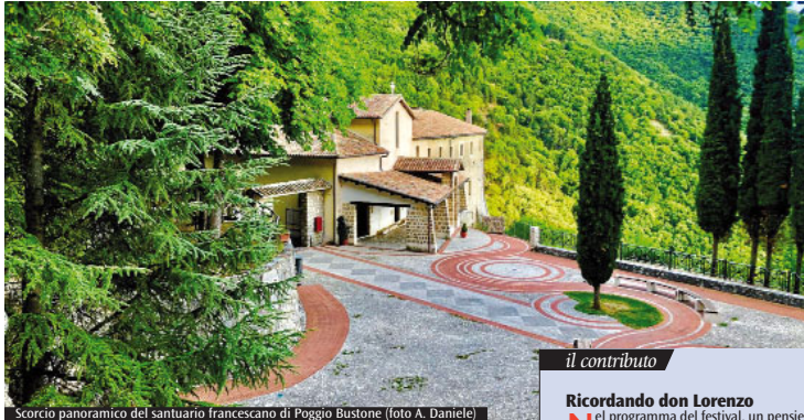
Scorcio panoramico del santuario francescano di Poggio Bustone

Pace e misericordia, nel nome di Francesco e del francescanesimo "autentico" che si respira nella Valle Santa reatina. Una giornata di riflessione a più voci, sul piano spirituale ma anche sociale, culturale, antropologico, attorno ai valori che si possono scoprire.