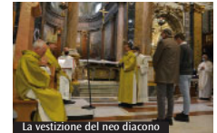
La vestizione del neo diacono

richiede una capacità di mettersi in sintonia con l'altro che passa attraverso il saperlo ascoltare. Con questo valore monsignore ha invitato a leggere il brano evangelico in cui Gesù proclama beati quanti ascoltano la Parola di Dio: chi sa ascoltare Dio, si pone in ascolto e in sintonia con il fratello. Questo è stato l'atteggiamento di san Francesco, in un certo senso imparato proprio a Poggio Bustone, dove «sperimenta il perdono a partire da questa persuasione: che ciò che è decisivo nella nostra vita è contemplare la realtà prima che volerla manipolare».