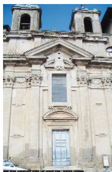
La facciata di Santa Rosalia

Incastonata nel Palazzo Barberini, la chiesa è ornata dalle sculture di Bernardino Cametti, allievo del Bernini